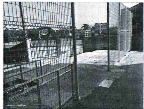
單一出入口管制人流