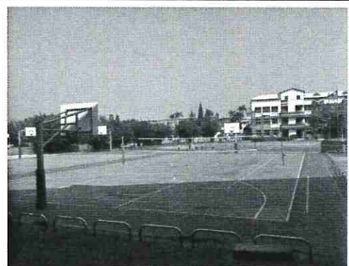
六甲國小綜合球場